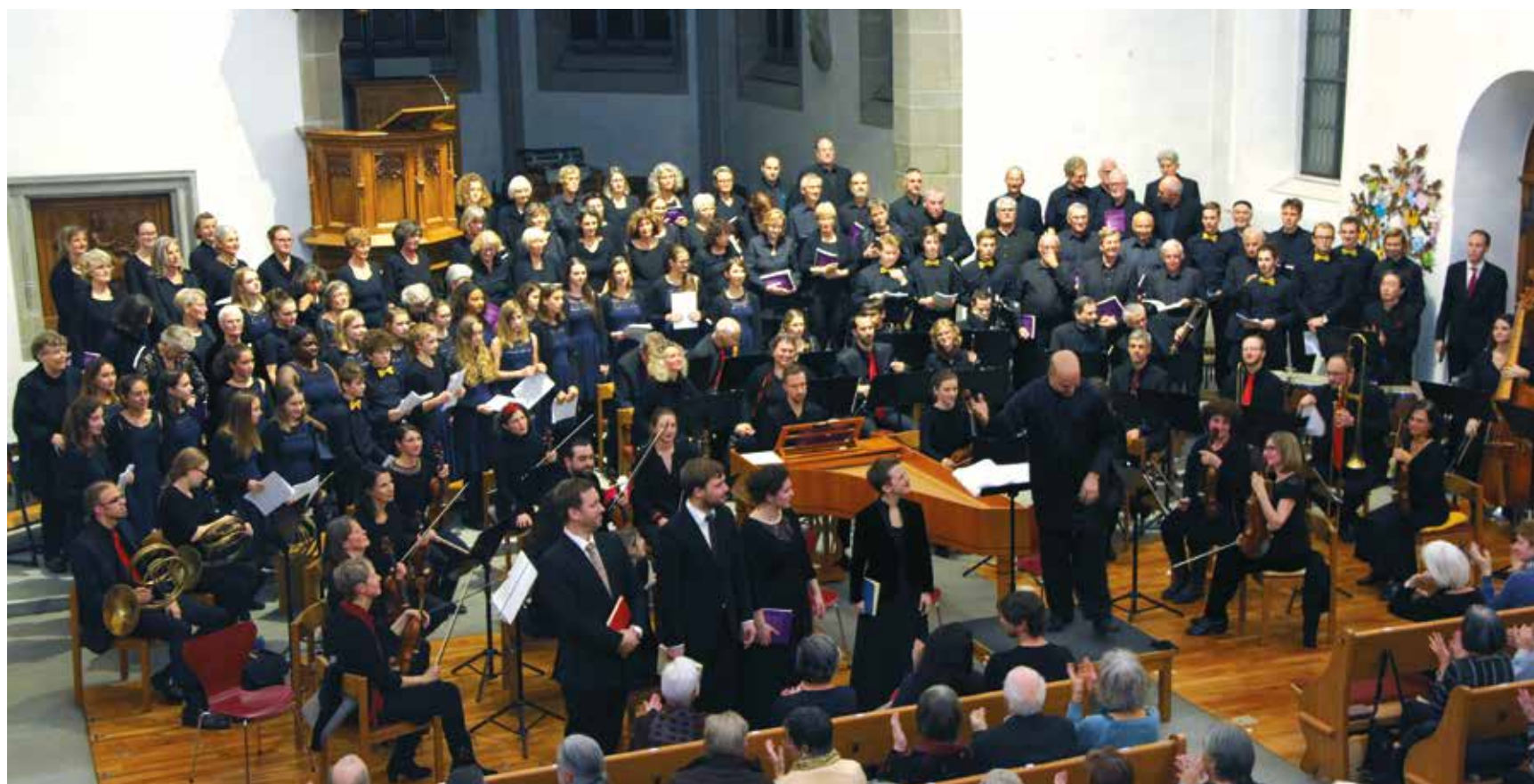
Kantorei Meilen, Singkreis Egg und Musikschule JMP sangen mächtig, aber transparent.

Glanzvolle «Schöpfung» in der reformierten Kirche